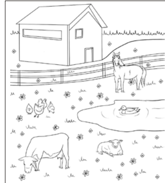
Findest Du alle 10 Fehler?